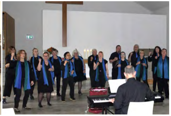
Praise Together singt bei der Gospelchurch Foto: beim Chorjubiläumskonzert am 22.06.24