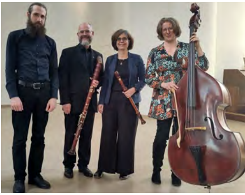
MusikerInnen des 7. Emporeo-Konzerts